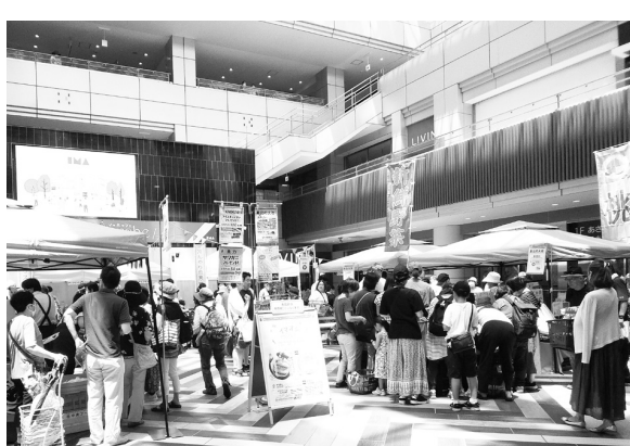
光が丘IMAの新名物に多数の人々が訪れた。

1987(昭和62)年4月24日、地元住民らの大きな期待を背負って「光が丘IMA」がオープンした。当時の入居数は9178、2020(令和2)年にはリニューアルを経て10月新オープンした。コロナの時代をぬけつつある今年、5月に続いて、7月29・30日に第2回「イマオシマルシェ」を1階光の広場で開催した。