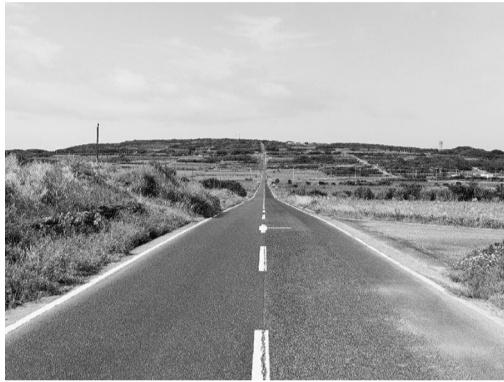
一本道 喜界島