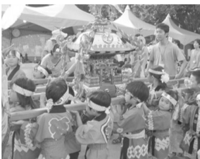
2014年夏の雲公園祭り

第36回までの36年間続けて来た「夏の雲公園まつり」ですが、5月14日の実行委員会において、廃止することが決定されました。廃止となった理由については、①運営スタッフの高齢化②あとに続く担い手が不足③長年続けてきた催し物に対するモチベーションの低下④資金不足等が挙げられ、コロナで実施できなかった影響も含めて、廃止を決断いたしました。 しかし、廃止のあとは、そのまま消滅することなく、3丁目の交流を図ることを基本として、若い世代と結びつけた新しい企画を考え実施して行くことになりました。残った繰越金や、協賛提灯、模擬店などもそのまま、新しい企画に繰り込む予定です。とりえず、今年の8月に予定されていた「夏の雲公園祭り」は取り止めとし、これから1年或いはそれ以上かかるかもしれませんが、新企画の構築に向けて発進して参ります。いままです以上にご支援頂けますようお願い申し上げます。 夏の雲公園実行委員会 及び実行委員一同