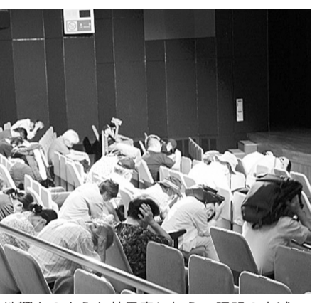
地震のような効果音に加え、照明の点滅や暗転等で火災時さながらの状況演出。