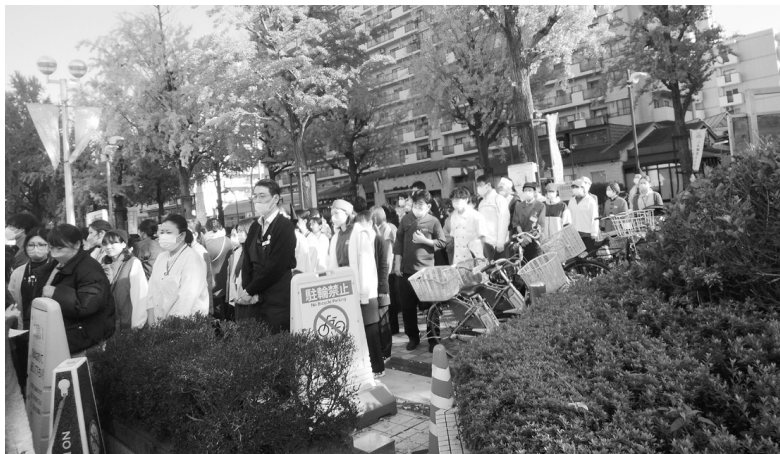
LIVIN光が丘店前に集って消防訓練が行われた

当日は、8時50分から9時40分迄、時間厳守で行われ、各店舗等から1名以上が参加した。訓練は総合訓練実施として、IMA防災センターより、15時、震度6強の直下型地震発生。それに伴い中央館3階LIVINで火災が発生、と放送があり、この前後に「これは防災訓練です」のメッセージも流れ、スムーズに実行された。訓練では、検証・通報消火をふまえて避難訓練を実施、約250名が参加した。 光が丘消防署、練馬都市ライフホールディングス、光が丘事業本部管理部長、光が丘IMA中央館統括防火・防災管理者らの総評では、「これ程多数の方々の訓練で、スムーズに行動できたのには感心させられました」と、あたたかい言葉があった。続いて消火器放射では、粉末消火器を使用し、3名が代表して訓練を行ったがLIVINの前での訓練のため、ほとんどの参加者はしゃがんで見学。ビニールの囲いの中にオレンジ色の粉末が放射されると「オー」などの声も上がって、訓練を終了した。