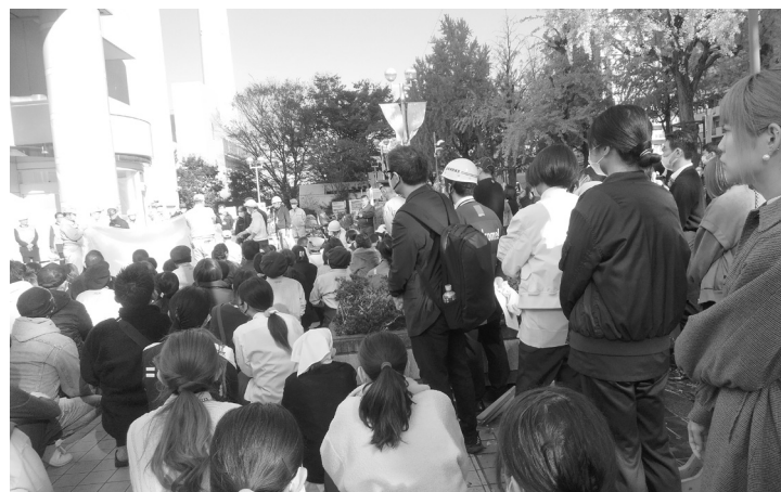
粉末消火器の放射を見守る参加者たち

お知らせ 令和6年1月5日(843)号は、年末年始につき、令和5年12月25日に発行いたします。 (株)光が丘新聞社 編集部 一同